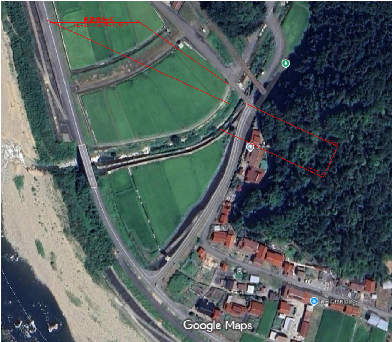
平 面 図